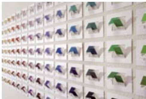
Maybe #05 (uncoated), 2006. pantone formula guide solid uncoated, cartoncino fustellato. Particolare dell'installazione presso galleria Artericambi.