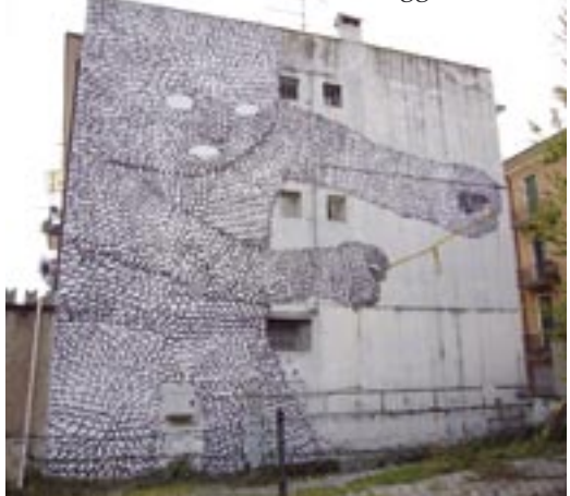
Muro dipinto a Verona, borgo Venezia 2007

In corso presso la galleria Artericambi la mostra personale di Blu fino al 19 maggio 2007.