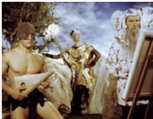
Memorias de Arkaran, 2005, stampa fotografica. 125 x 150 cm.

(Olot, Spagna, 1971, vive e lavora a Barcellona)