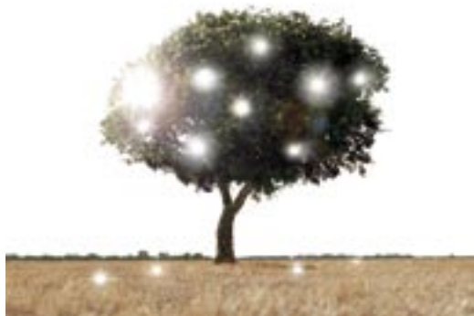
La morte di un'immagine #3, 2005. Stampa fotografica. Edizione di 5 esemplari in differenti formati. Courtesy galleria Artericambi