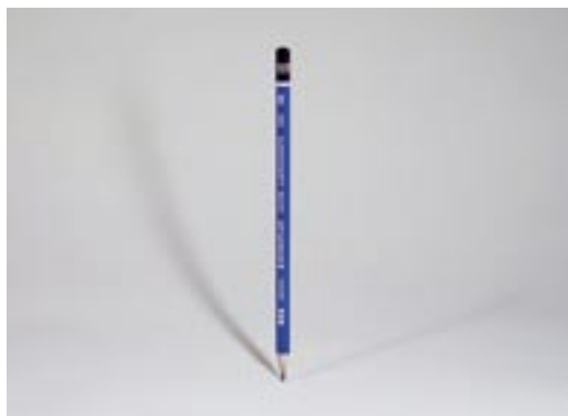
The standard model, 2005, fotografia su alluminio d-bond, 70 x 67 cm.

Steven Pippin Nato nel 1960 a Redhill -Gran Bretagna. Vive e lavora a Londra.