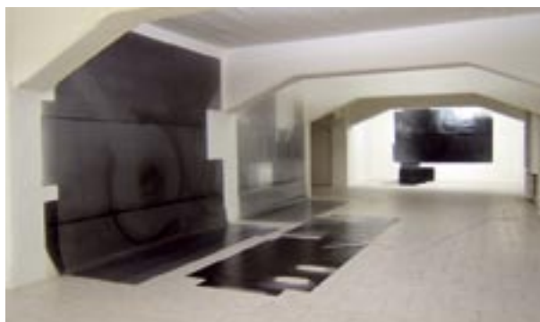
Appartamento, 2007. impressione diretta su carta fotosensibile. Veduta dell'installazione in galleria Artericambi.

Scultore per formazione, questo artista porta ora avanti con serietà e impegno una ricerca sperimentale di grande interesse nel campo della fotografia, lavorando per impressione diretta su carta fotosensibile. Suggestive le stampe in scala 1:1 che riportano la registrazione di interi ambienti domestici, ottenuta direttamente dall'iscrizione della luce o i risultati astratti della proiezione video su carta fotografica, accumulato di tempo su una pellicola in continuo divenire.